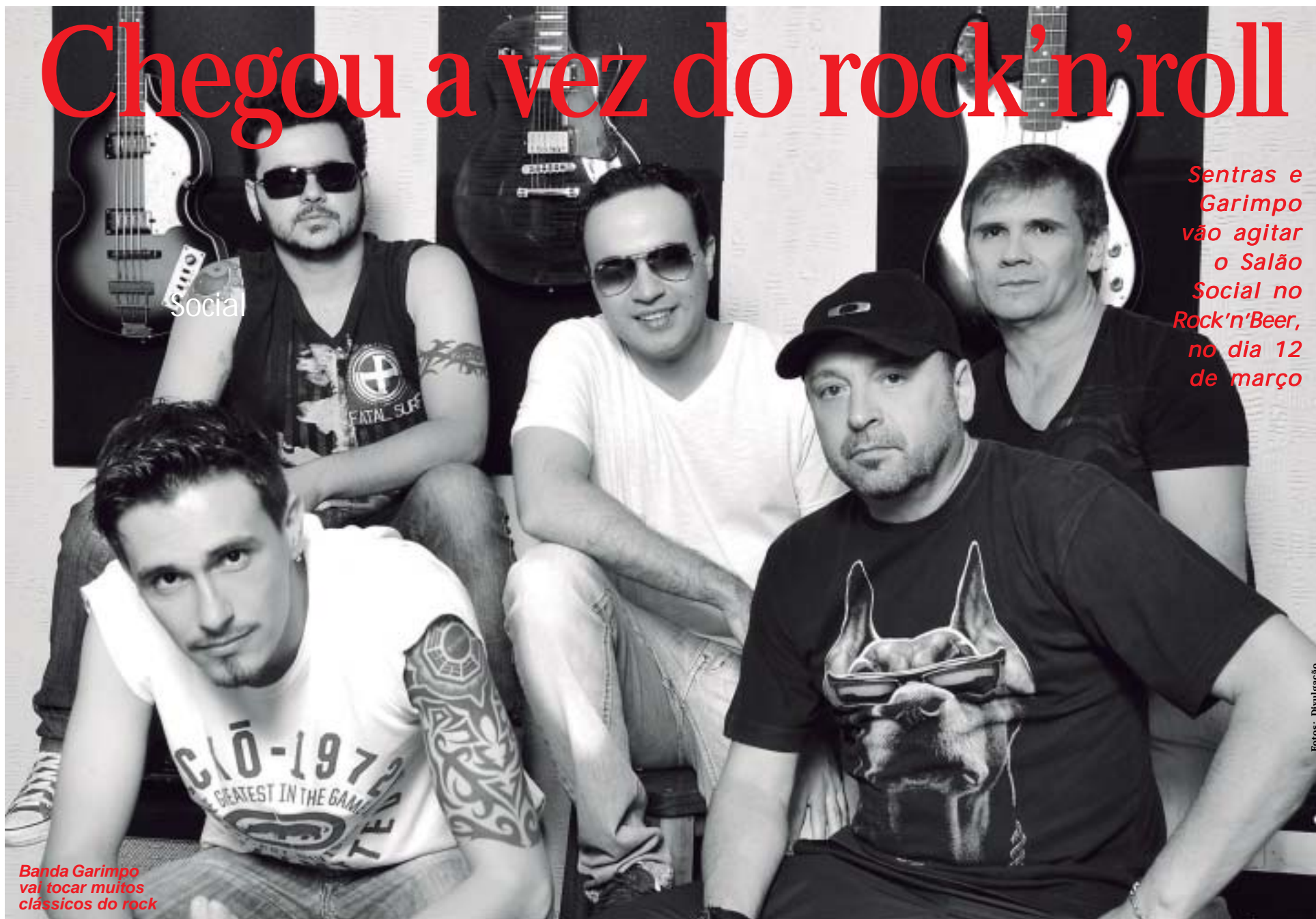
Banda Garimpo vai tocar muitos clássicos do rock

Sentras e Garimpo vão agitar o Salão Social no Rock'n'Beer, no dia 12 de março