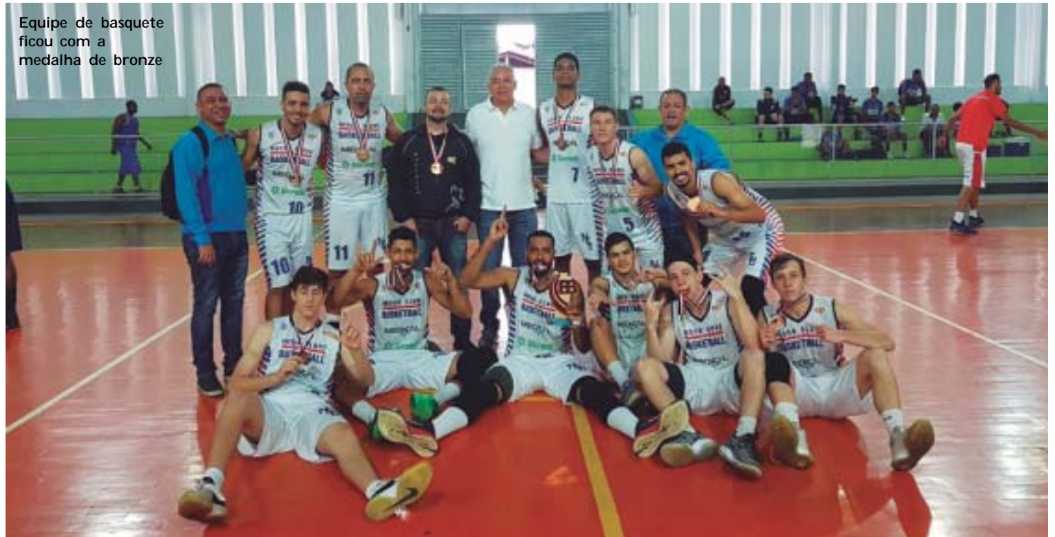
Equipe de basquete ficou com a medalha de bronze