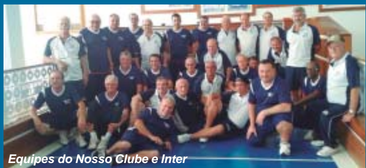
Equipes do Nosso Clube e Inter

Não poderia ter sido melhor a estreia do Nosso Clube no Campeonato Metropolitano de Bocha 2016, no dia 19 de março. Jogando em seus domínios, os nossoclubinos venceram a forte Internacional de Limeira de virada, por 3 a 2. Promovida pela Liga Campineira de Bocha, a competição conta com a participação de 10 equipes, representando 6 cidades, que se enfrentarão em turno e retorno. O próximo compromisso dos nossoclubinos será novamente em casa, desta vez contra o Sayão, de Araras, no dia 3 de abril, às 9 horas. No dia 5 de março, aconteceu o Torneio Início da competição e o Nosso Clube foi a sede de algumas partidas. Após bater o Gran por 2 a 0, os nossoclubinos foram eliminados, por 2 a 1, pela Vila Marieta, de Campinas, que terminaria com o vice-campeonato. Na final, os campineiros perderam para Piracicaba.