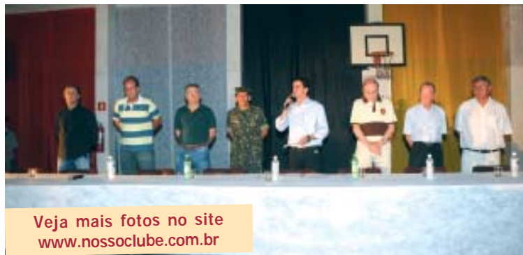
Mesa dos dirigentes do Nosso Clube e das autoridades