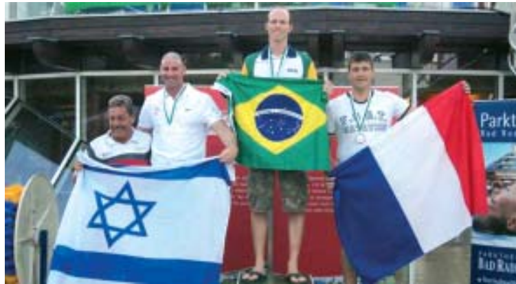
O diretor do Nosso Clube no lugar mais alto do pódio