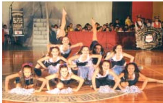
Apresentação da equipe de ginástica

O tema da cerimônia de abertura, iniciada com a entrada das delegações que representaram as modalidades em disputa, foi “Ontem, Hoje e Amanhã”. Em seguida, houve a apresentação da Banda Marcial do Senai de Limeira, que executou o