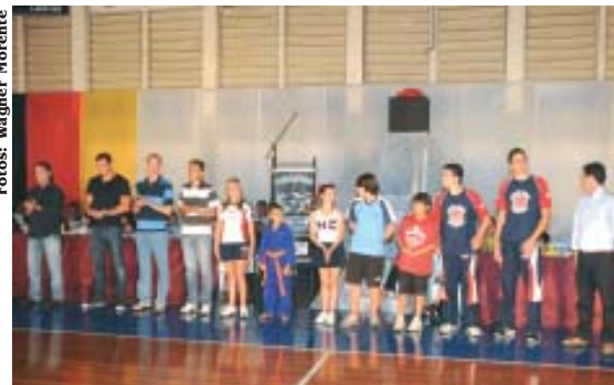
Atletas nossoclubinos homenageados