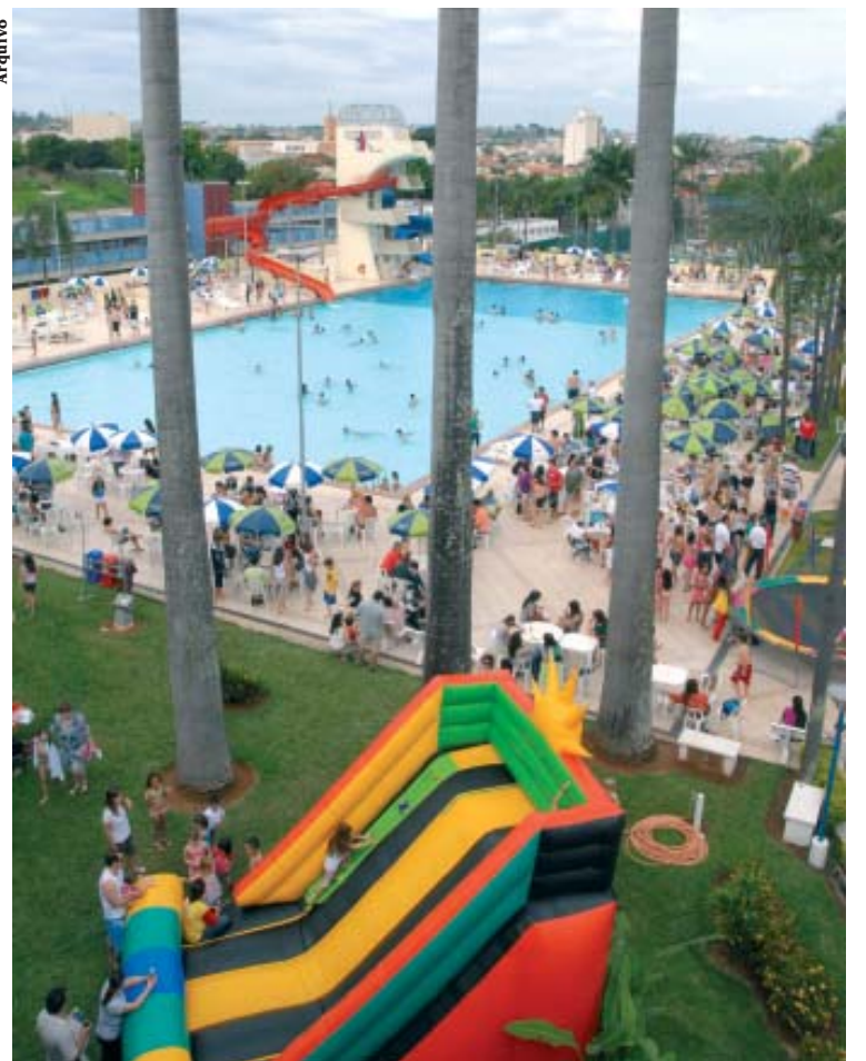
Festa das Crianças no Nosso Clube é garantia de diversão

Associados não pagam para participar, mas podem contribuir com as entidades assistenciais de Limeira doando produtos de higiene pessoal ou alimentos