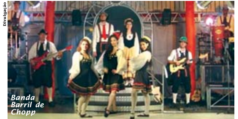
Banda Barril de Chopp

responsabilidade da banda Barril de Chopp, que estreia nos eventos nossoclubinos prometendo uma caprichada seleção de músicas típicas, além de covers de grandes hits de todas as décadas.