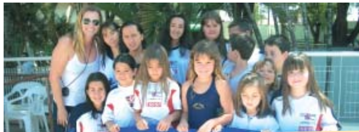
Confira as classificações individuais dos nadadores no site www.nossoclube.com.br , seção Notícias